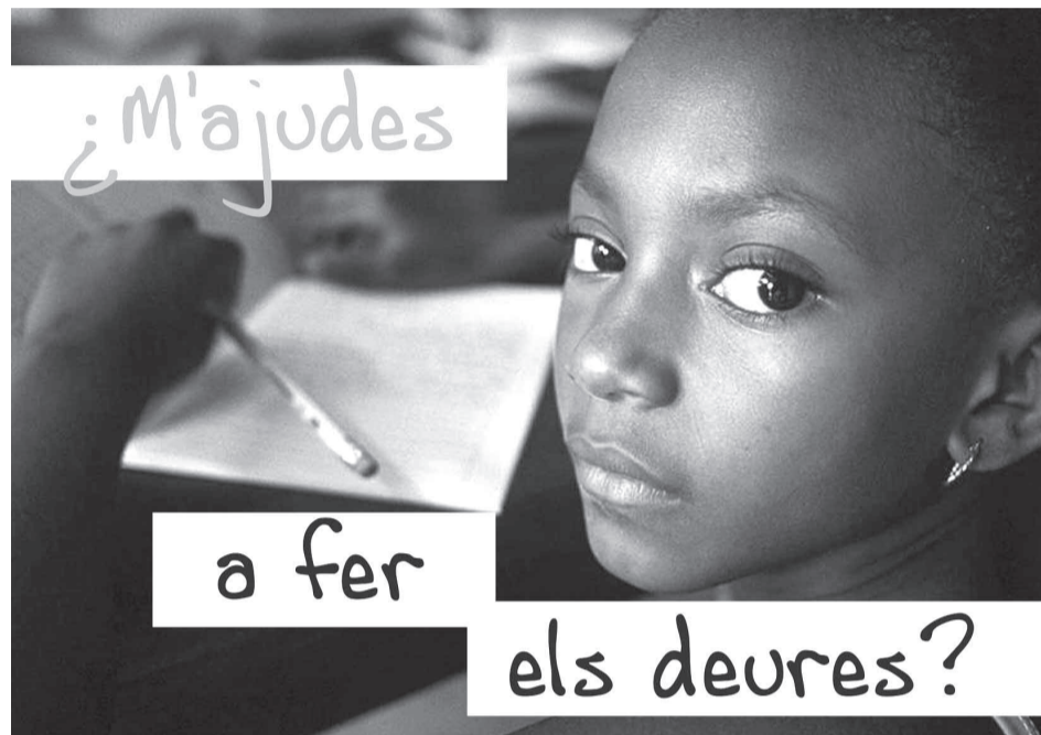
Cartell de la nova campanya d'Adsis.